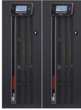
รูปภาพเครื่องสำรองไฟ UPS Riello ขนาด ๑๐ KVA จำนวน ๒ เครื่อง